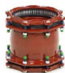
GF Multi Joint Reparaturkupplungen