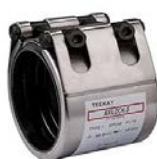
Reparatur- und Montagekupplungen